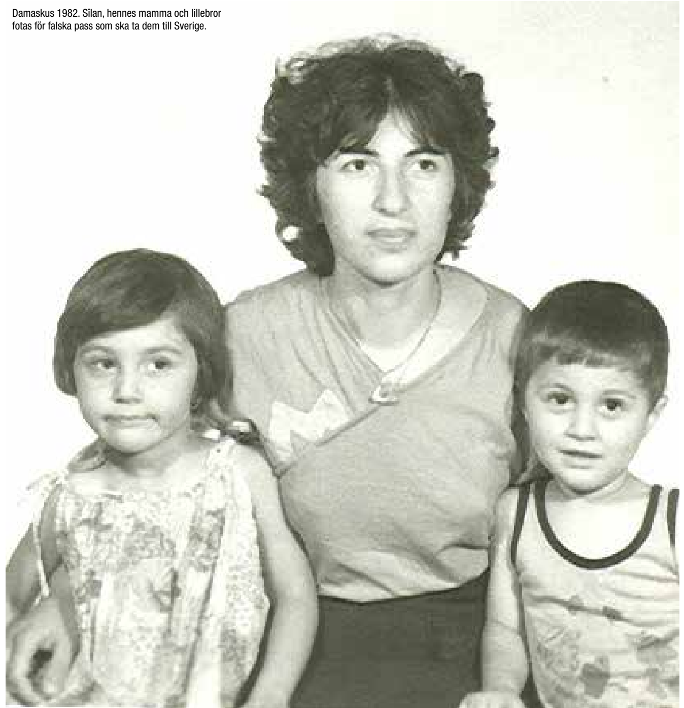
Damaskus 1982. Silan, hennes mamma och lillebror fotas för falska pass som ska ta dem till Sverige.

"Jag blev så starkt berörd att jag hade en obehagskänsla i kroppen efteråt! Efter föreställningen ville jag inte riktigt prata om pjäsen, tills känslorna hade lagt sig." Publikröst ur Ung scen/öst